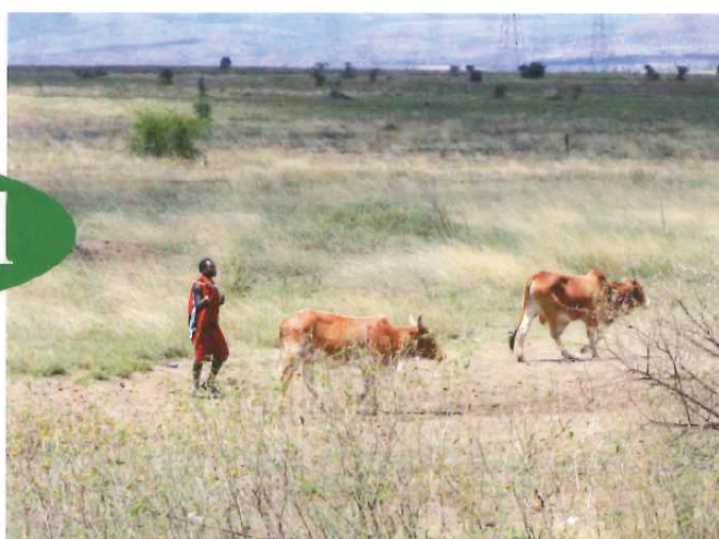
キリマンジャロのあるタンザニアの人たちの暮らしは実に質素。皆無というわけではないが、環境に与えるストレスは極めて少ない暮らしぶりであった。

地球温暖化の原因となる温室効果ガス、その一つである二酸化炭素の排出について考えてみた。もし、