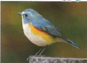
通常は、「チッチッ」という鳴き声だが、さえずりは、まるで口笛のようなきれいな声。

瑠璃鶉 【Red-flanked bluetail】 スズメ目ヒタキ科 14cm