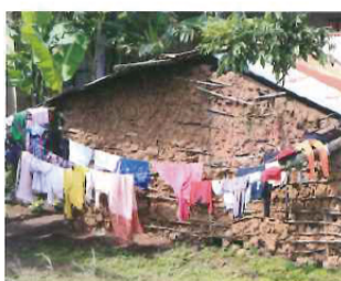
タンザニアでニッポンの悪しき営みを謝りたい。そんな気持ちになった旅だった。

キリマンジャロのあるタンザニアの人たちが、二酸化炭素をバンバン排出して、それが原因で地球温暖化を促進し、氷河が溶けているとしたら、それは自分たちの責任と言えるだろう。