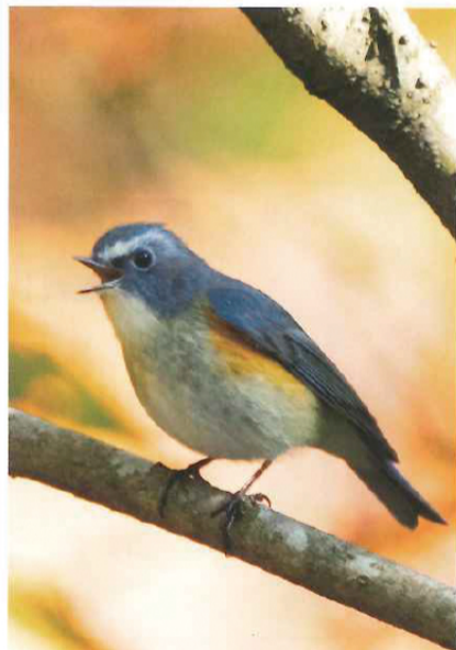
冬場から春にかけて、大岡川源流域の氷取沢周辺で見られる。

冬から春までの間、氷取沢周辺を散策中、もしも「チッチッ」と声が聞こえたら、本種を観察することができるかもしれません。