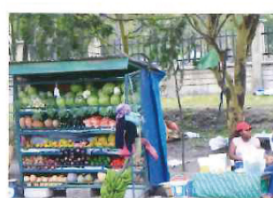
よそのどこかの国のとぼっちりを、この国の人たちはもろにかぶってしまっている。

しかし、どう見てもここに原因があるようには思えない。産業は農業と放牧による酪農がメイン。質素な家で暮らし、電気は通じてはいるものの、街から外れれば、そこではランプを使っていた。タンザニアの人たちの暮らしに原因があるわけではないのだ。