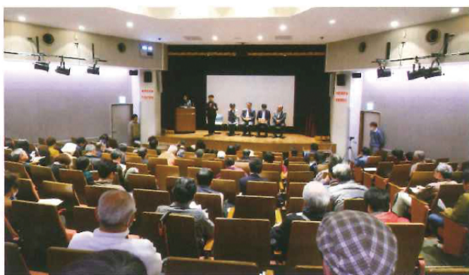
第2回口頭弁論後の日比谷図書館での報告会と勉強会の様子。