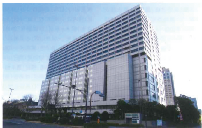
東京地方裁判所がある合同庁舎ビル。簡易裁判所や高等裁判所もこのビルの中にある。なかなか行く機会のない建物だが、今回編集部は傍聴にトライした。

石炭火力発電が排出する二酸化炭素による地球温暖化、大気汚染と、温排水による漁獲量の減少を挙げ、さらに温暖化については、昨今の「過去に例が