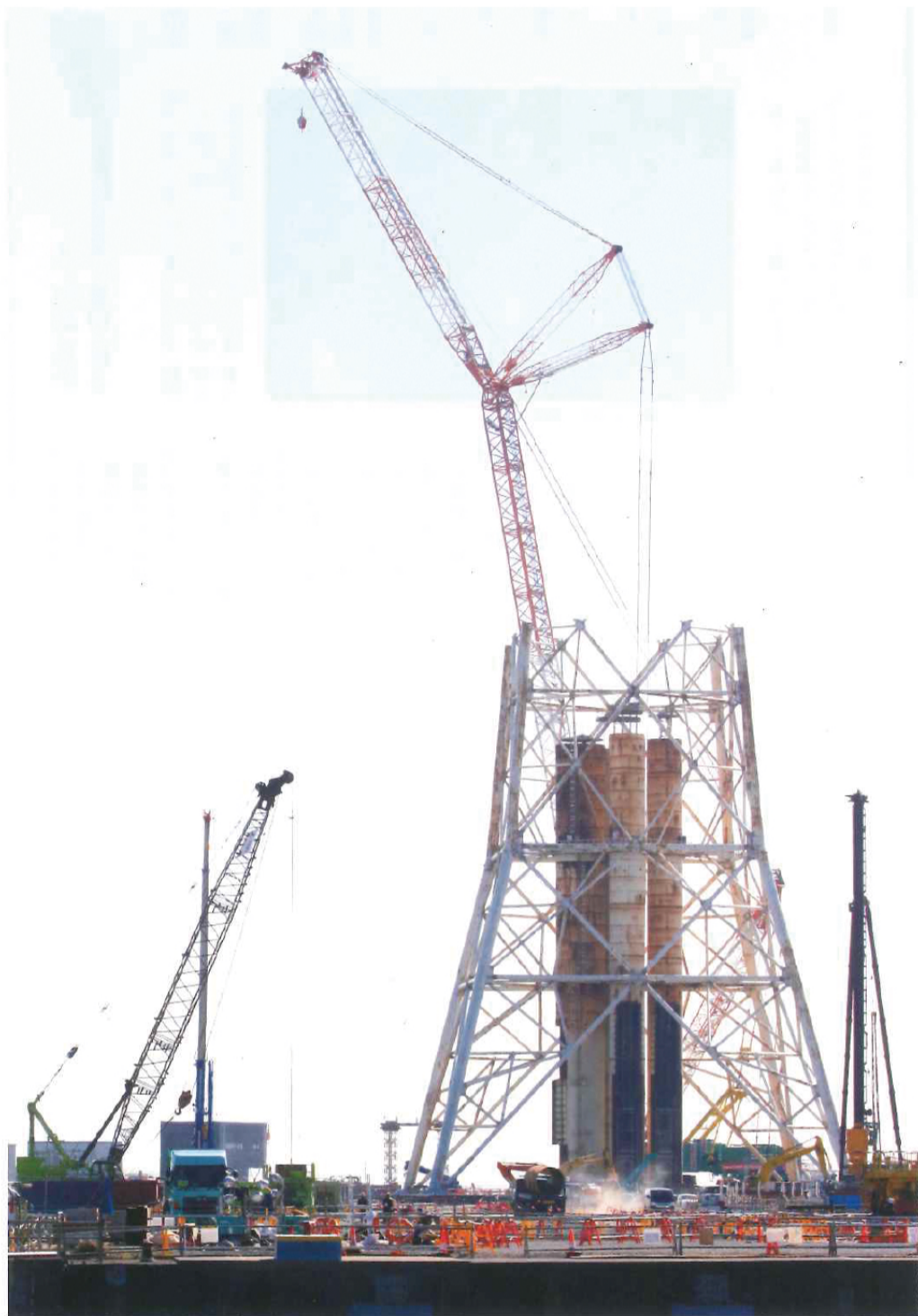
1月中旬、横須賀市久里浜の火力発電所では、老朽化した以前の火力発電所を解体中。並行して、新しい石炭火力発電所建設の基礎工事も始まっていて、現場には多くのコンクリートミキサー車が出入りしていた。