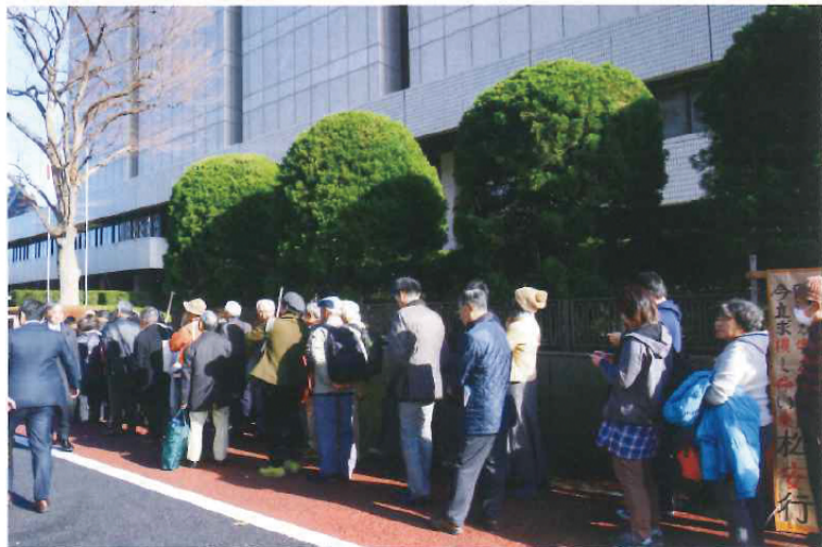
東京地方裁判所の門の外まで傍聴整理券獲得のための列が続く。

2019年10月2日、第一回口頭弁論(傍聴席数を上回る約150名のサポーターが集まる)