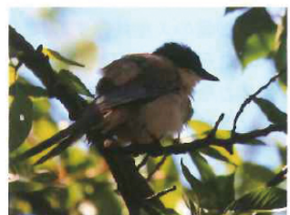
この時期、川沿いの桜並木で見かけることが多い。

名前の通り、長い尾を持ち、頭部は黒いヘルメットをかぶったようで、背から腰は灰色、翼と尾は