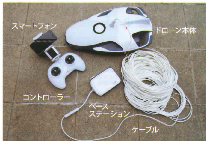
水中では電波が通じにくいので有線で、ケーブルは70mもある。『Power Ray』はフルセットで購入すると、これら一式がキャリーケースの中に入っている。