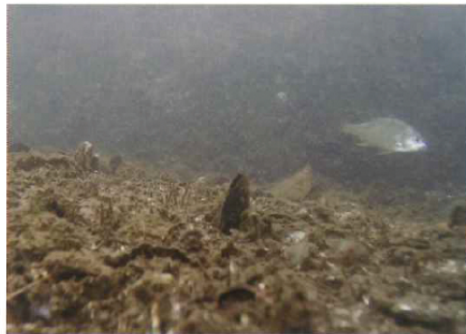
5月19日水中ドローンで撮った大岡川桜橋付近の川底。

詳しい情報は、PowerVision http://www.powervision.me