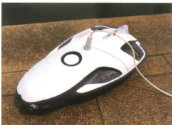
簡単に言うと、カメラ付高性能ラジコン潜水艦。これが『Power Ray』。Rayとは魚類のエイのこと。スタイリッシュなエイの形をしている。