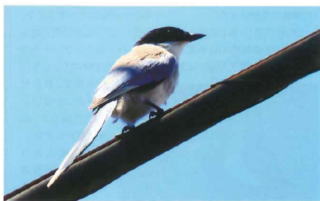
電線にとまって周囲を見渡す。同じ仲間のカラスには警戒心が強い。撮影場所:弘明寺ブロード

明寺周辺の桜並木で営巣しているこのオナガは、近づいてきたカラスを威嚇していました。