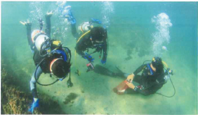
ダイバーにより、海底に沈むゴミを回収しました。

●9月10日(日) 回収ゴミ重量20.11kg (うち、釣り具を含むプラスチックゴミ7.61kg)