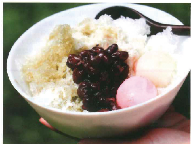
この日のスペシャル、「ミルク宇治金時白玉トッピング」。

第三弾は、水取沢鍋になるのか水取沢茶会になるのか、それとも、少し下流の水に挑戦するのか……。いずれにしろ、一緒に挑戦したり、新たな企画を提案したり、冷笑したりしながら、引き続き、本企画を温かく見守っていただければ幸いです。