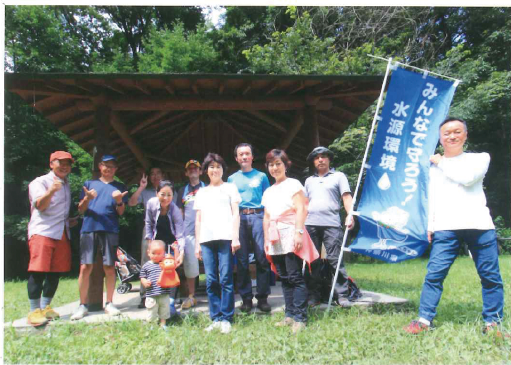
『かながわの源流域探索ツアー』の参加者全員が「水取沢自己責任水」をいただいた。