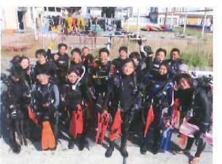
両日で50名のダイバーにご協力いただきました。

今後は釣り関連の企業やメーカーとも連携し、展開することを目指します。また、11月には茅ヶ崎で海底清掃を行なう予定です。