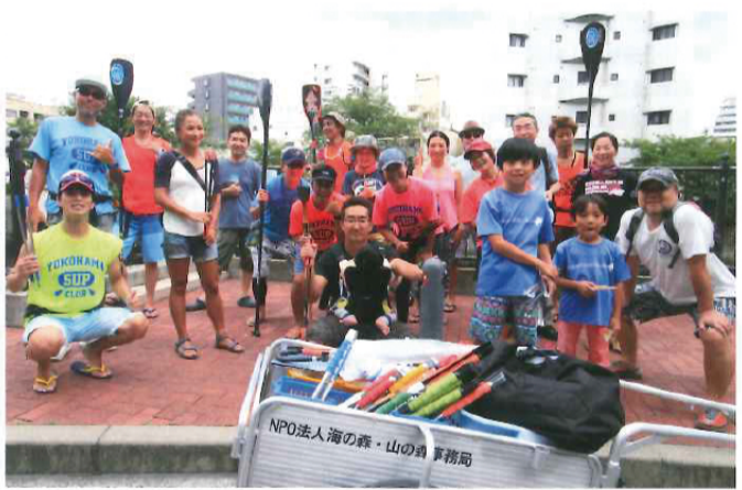
陸上班、SUP班、ボート班の3班でアクティブにゴミを拾います。

TOTO株式会社「水環境基金」から助成を頂き、活動を展開している「大岡川PGT大作戦」。毎月2回(第一土曜日は井