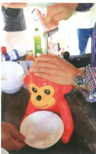
手動ゆえに時間がかかります……が、森の中では、それも楽しみに。

8月末に開催した当NPO主催、神奈川県もり・みず市民事業支援補助金対象事業『かながわの源流域探索ツアー』の最後の行程に組み込みました。涼しい日が多かった今年8月の関東地方でしたが、この日は見事なかき氷日和。『水取沢氷』かき氷大会開催の運びと相成りました。