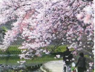
『桜まつり』の頃の大岡川。

大岡川をより大切に、そしてもっとアクティブに楽しむために、当NPOでは、大岡川が『地域産業資源』に認定されるための働きかけを行なってきました。そして、この9月、申請が受理され、神奈川県より正式に認定されました。