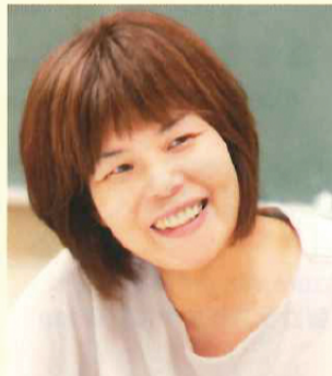
会社員から転職されたユニークな経歴の持ち主でもある。