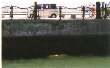
点在する荷揚げ場の跡が、恵まれた水運環境の歴史を物語る。

美しく整備された古い橋と、護岸のあちこちに残る荷揚げ場の跡。これは恵まれた内陸水運の証であり、ここにも横浜の港町ならではの雰囲気がある。