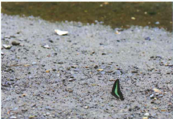
初夏の陽射しの下で、神秘的な美しさを放つ。発見場所:弘明寺観水エリア

翅を全開にしたときの横幅6~7cmほどの小型の蝶で、本州以南から東南アジアにかけ広く分布しています。クロタイマイとも呼ばれています。