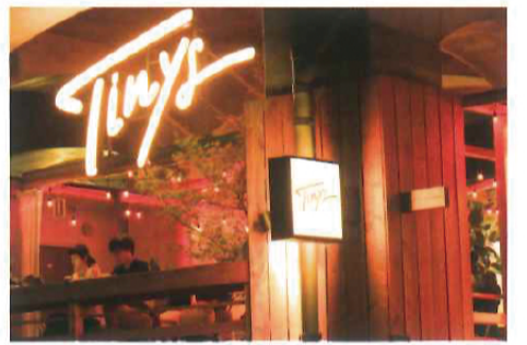
「Tinys Living Hub」カフェタイム11:00~14:00/バータイム18:00~22:00(火曜定休)

また、ここにはカフェラウンジ「Tinys Living Hub」と宿泊施設「Tinys Hostel」が併設されて