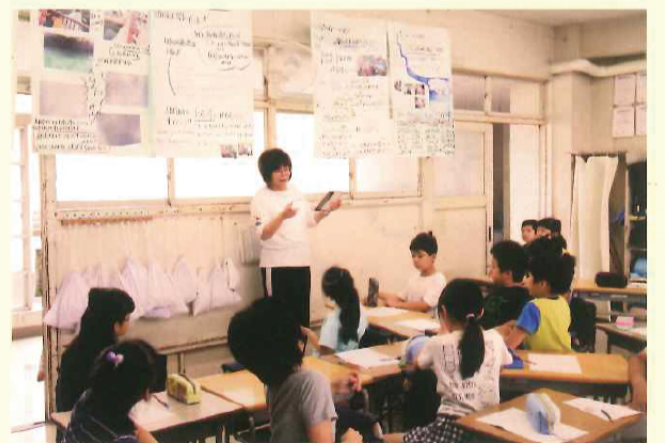
子どもたち自ら地域の課題を見付け取り組み発表する「総合学習」授業風景。