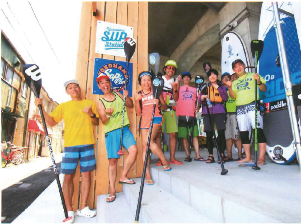
多くの初心者から経験者まで大歓迎!レッスンはSUPA(日本スタンドアップパドルボード協会)公認インストラクターがサポートしてくれる。横浜SUP倶楽部 http://yokohamasup-club

京浜急行の高架橋がすぐそばを平行して走り、時々赤い電車がゆく。川の両岸には並木がふちどり、地面は比較的近く視野は広い。加えて、そこに残るノスタルジックなシチュエーションがこの地域の最大の魅力だろう。さあ、次は上流を目指そう。