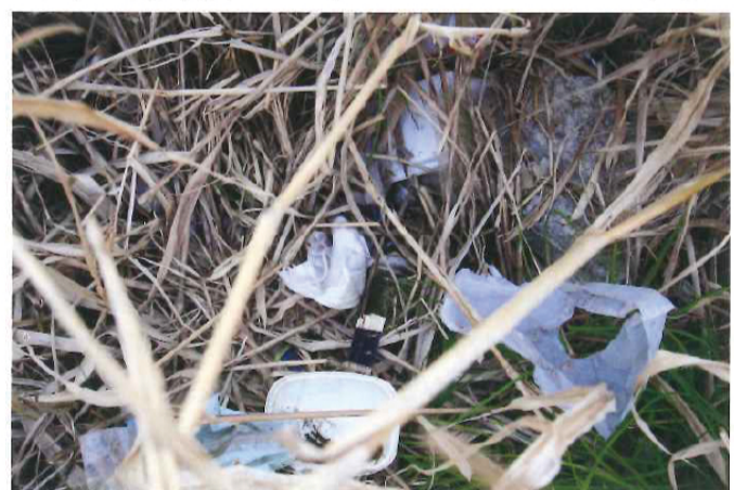
漂着したプラスチックゴミは、強風に吹き飛ばされて島内の草や低木の茂みに奥深くに引っかかっています。紫外線でプラスチックが劣化し、バラバラになってマイクロプラスチック化します。

ゴミの総重量 61.364kg (うちプラスチックゴミ24.78kg) 主催:NPO法人海の森・山の森事務局 協力:城ヶ島ダイビングセンター、ダイワ(グローブライド株式会社)、城ヶ島漁業協同組合 助成:一般財団法人セブン-イレブン記念財団