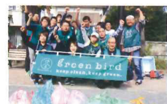
井土ヶ谷エリアはグリーンバード横浜南との協働開催。ゴミの量は比較的に少ない。

基金のゴミ拾いに参加してくれているのだ。今年さらには多くの他の小学校も巻き込んで、このゴミ拾いを子どもたちのチカラで盛り上げてもらえるような展開を当NPOはプロデュースして行くつもりである。