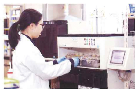
BOD検査は、20℃に試料を保ち、光のないところで5日間放置したのち、消費された酸素量を計ります。

会貢献活動としてNPO法人濱橋会と協働で、大岡川の水質調査を年に2回(2月と8月)ずつ、源流域から河口域まで4箇所で行なっています。今後、本紙でその水質