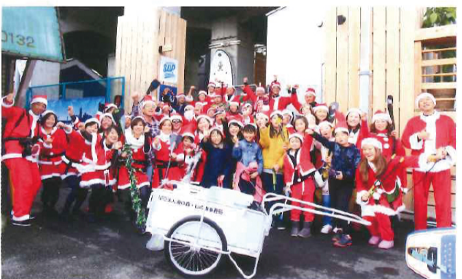
12/23はXmasバージョン、全員がサンタのコスプレでゴミ拾いを実施。日ノ出町・黄金町エリア。

昨年、とてつもない協力者を得た。日枝小学校4年3組の子どもたちである。環境出前授業をきっかけに、自分たちで大岡川を綺麗にして泳ぎたい、その目標に向かって毎回自主的に当NPOと横浜SUP倶楽部とで主催・助成:TOTO水環境