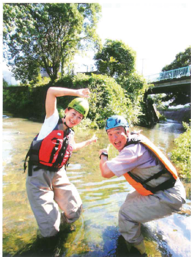
いつもは左へさかのぼり、源流域・水取沢に向かうが、今回は右の日野川へ!

大岡川支流『日野川』の流れはどこから? 日野川の暗渠の先、水なき水辺をたどった。