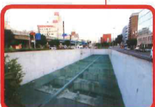
吉田橋……派大岡川は1971年に藤河川となり、その跡には1978年に半地下構造の首都高横羽線が開通した。両岸の地上部は新横浜通り。吉田橋は架け替えられ今も存在する。