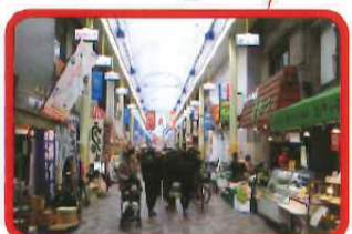
横浜橋商店街……かつて吉田新田の中央を流れていた吉田川(中川)に架けられていた「横浜橋」。1972年の埋め立て完了とともに橋は無くなったが、名前だけが今も残る。