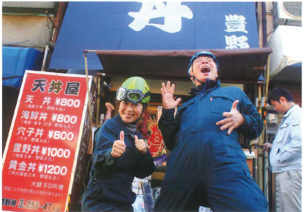
豊野井……新鮮な魚介と季節の野菜の天丼を格安で提供してくれる。地元の人気店。地下鉄東橋駅近くにある。こちらも、運河の埋め立てで無くなった橋の名前が駅名として残る。