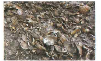
三殿台遺跡にある貝塚のはざとに標本……かつて海だった痕跡だけでなく、この遺跡は、大岡川流域の原始・古代のムラの様子と当時の生活を知ることができる貴重な場所でもある。