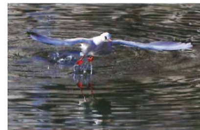
川面で休み、ときどき飛び立つ。日の出後橋付近にて。

ミネコとよく似ていますが、本種の特徴は、くちばしがオレンジ色に近い赤色で、その先端が黒いこと。また、眼の上側と後方に黒斑があり、脚が